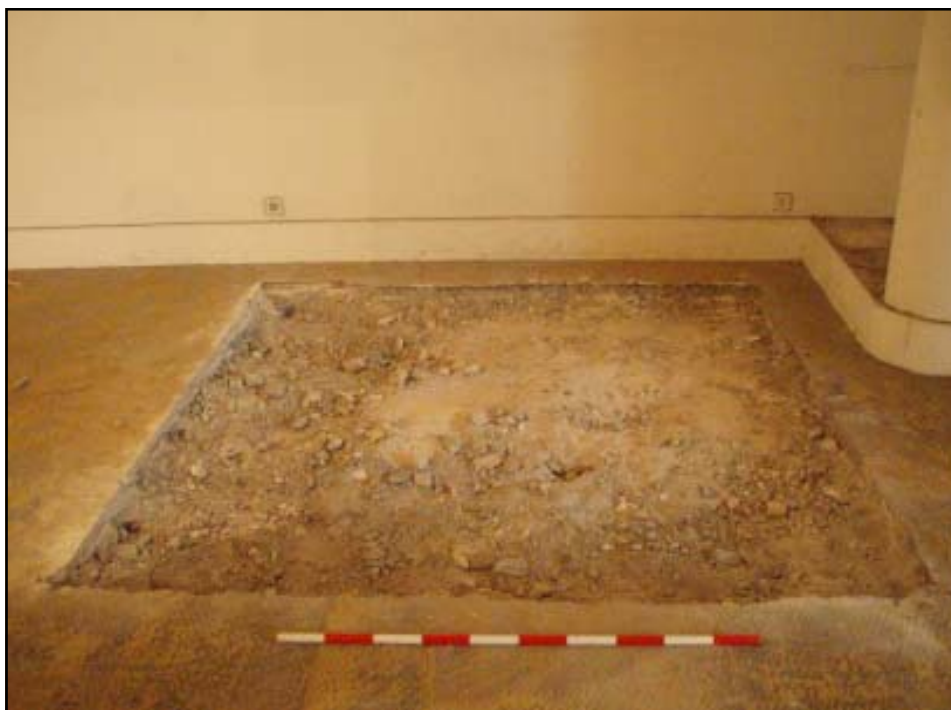
Vista de la U.E. 03

A continuació és va localitzar a 4.55 m s.n.m. un estrat (U.E. 03) de 30 cm de potència, format per terres de color marró clar poc compacte amb la presència de petites pedres, material constructiu i restes de ciment. Aquest estrat es va interpretar com un nivell de reompliment que amortitzava a una estructura la U.E. 04.