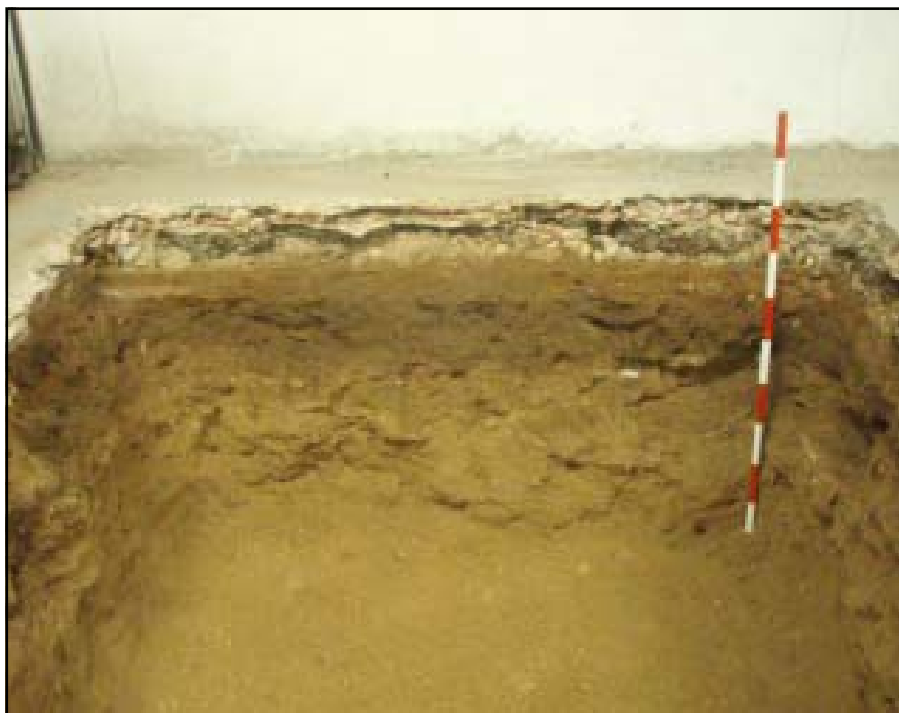
Detall estratigràfic del sondeig 3

Possiblement es correspondria a un estrat de reblliment, sense que haguem localitzat cap estructura que es pogués vincular a aquest moment. Per sota de l'U.E.204 s'ha documentat un estrat, l'U.E. 205 localitzat a 0.90 m s.n.m., de 16 cm de potència, format per un nivell sorrenc de color marró amb la presència de petites pedres i fragments de material constructiu (maons). Aquest estrat ha estat datat igualment entre els segles XV-XVI.