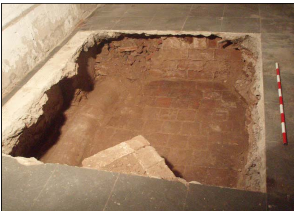
Conjunt d'estructures, U.E. 504, 506, 507 i 511

Aquesta estructura estava construïda sobre un nivell de circulació, U.E. 507, del qual també era cobert per l'estrat 505. Aquest, va ser localitzat a 3.76 m s.n.m. i era format per un paviment de rajoles rústiques de mides irregulars d'entre 18 x 18 x 02, de color marró i lligades amb morter de calç, el qual s'adossava a un pany de paret, l'U.E. 506, aixecat a partir de maons de 22 x 14 x 02 cm i del que s'havia conservat un alçat de 62 cm. Aquesta estructura presentava una orientació E-W i es va interpretar com un envà, el qual va ser datat cronològicament, juntament amb el paviment 507, entre els segles XIX-XX. Aquets dos elements, l'U.E. 506 i 507 van ser arrasades per la banda nord del sondeig, per la U.E. 511, format per un tub d'uralita de secció cilíndrica corresponent al clavegueram actual de la finca.