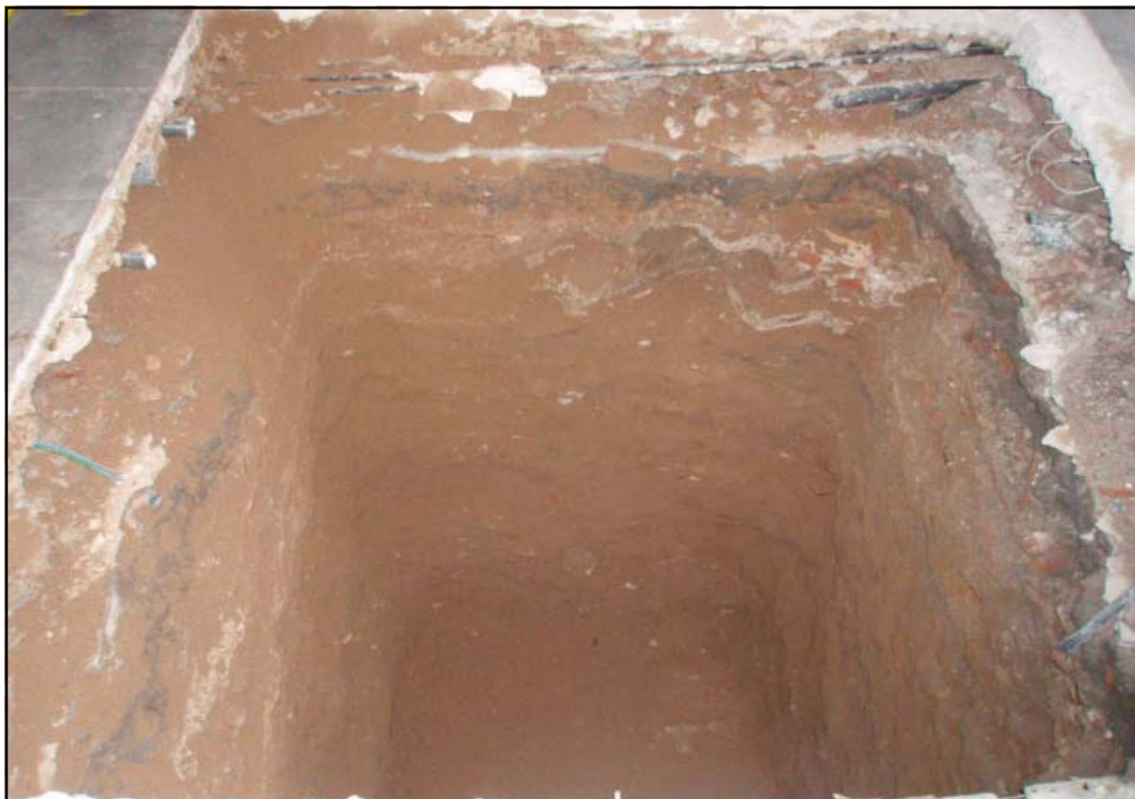
Vista final del sondeig

Un cop documentat, es va procedir al desmuntatge, amb el permís del Museu d'Història de la Ciutat, per tal de continuar amb el rebaix manual; seguidament va aparèixer un estrat, l'U.E. 412 localitzada a 3.66m s.n.m., de 14 cm de potència, format per terres de color marró fosc poc compacte, del qual no es va recuperar material ceràmic i es va interpretar com un nivell de reompliment. Per sota d'aquest, es va documentar l'últim nivell antròpic a l'interior del sondeig, corresponent a la U.E. 414 i localitzat a 3.52m s.n.m., format un estrat, de 1'36 m de potència, de terres sorrenques de color marró, amb la presència de material constructiu i petites pedres, el qual es va interpretar com un nivell de reompliment i del que es va recuperar material ceràmic datable entre els segles XVII-XVIII. Aquest nivell ha estat igualat a l'U.E. 09 del sondeig 1, i a la U.E. 108 corresponent al sondeig 2, per les mateixes característiques morfològiques, cronologia i cota d'aparició.