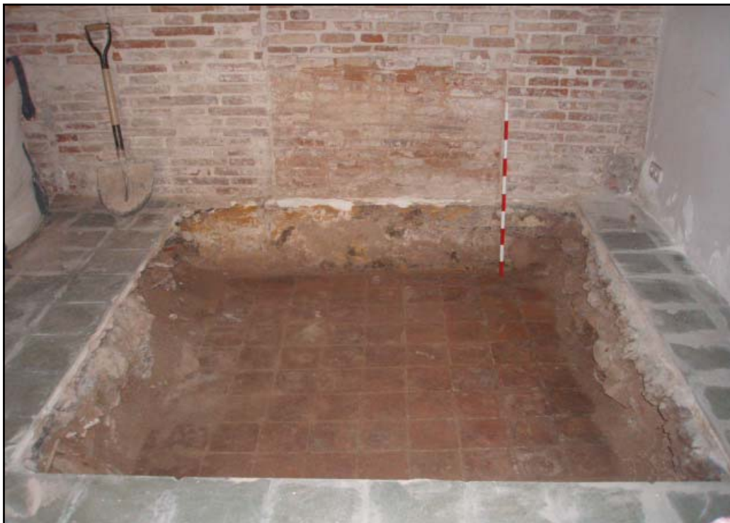
Vista del paviment 104

Per sota del paviment U.E. 104, s'ha localitzat un estrat, l'U.E. 105 a 4.21 m s.n.m., de 10 cm de potència, format per terres de color marró fosc mitjanament compacte, que correspondria a la preparació d'aquest paviment. Un cop retirada l'U.E 105, es va localitzar l'U.E. 106 (a 4.11 m s.n.m.). Presentava 35 cm de potència i estava format per terres argiloses de color vermellós mitjanament compactes. Considerem que aquest estrat es correspondria a un nivell de reompliment, del moment de la construcció de l'edifici (segle XIX).