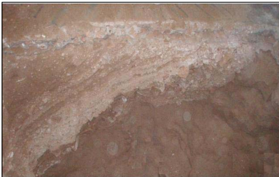
Detall estratigràfic del sondeig 4