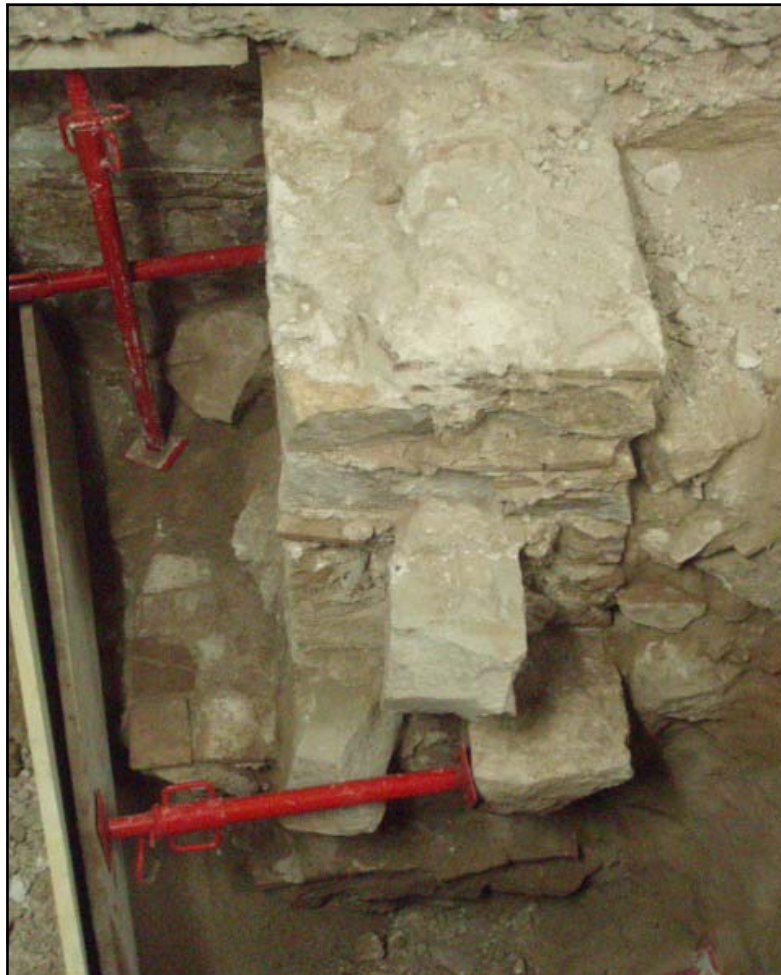
Vista completa de lé estructura 303

Estava realitzada a partir de blocs mitjans de pedra i maons col.locats horitzontalment i lligats amb força morter de calç de color blanc. Es caracteritzava per tenir 3 grans blocs de pedra escairats que sobresurtien per la seva cara nord i presentava, a una cota més baixa, una base plana feta de llosetes de mides irregulars. Aquesta, també sobresurtia de la planta i probablement funcionava com una plataforma on s'assentava una part d'aquesta estructura. Aquesta s'ha interpretat com un fonament de l'antiga finca, datat del segle XIX, ja que s'adossava a la paret perimetral sud de l'edifici (U.E. 307). Aquest parament presentava la mateixa tècnica constructiva que el fonament, és a dir, aixecat a partir de blocs mitjans de pedra escairats i lligats amb força morter de calç blanc i fragments de maons, per tant pertanyien al mateix moment d'edificació.