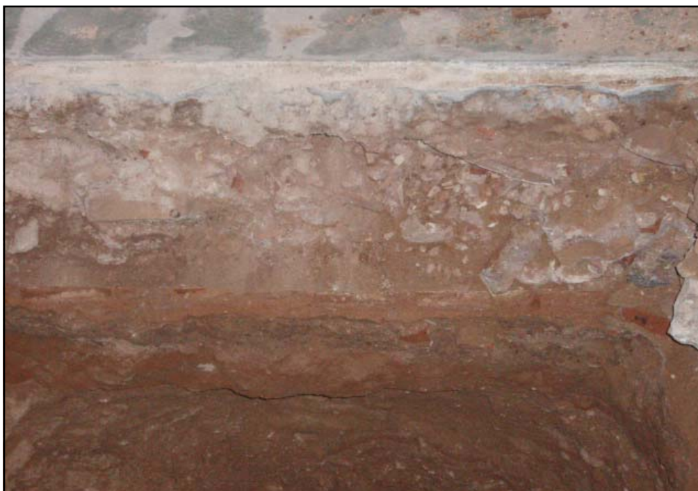
Detall de l'estratigrafia del sondeig 2