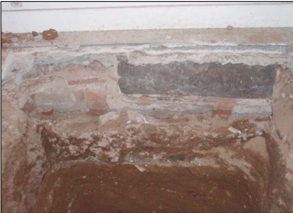
Conjunt d'estructures U.E. 04, 07, 11

Seguidament, es va posar al descobert una estructura, l'U.E.11 a (4.23 m s.n.m.), de secció circular i amb un diàmetre de 35 cm. Aquesta discorria paral·lela al mur perimetral est de la finca i s'hi adossava la paret nord del dipòsit U.E. 04. L'U.E.11 corresponia a un tub d'uralita i funcionava com l'actual desaigüe de la finca. Aquest element, anava encaixat a l'U.E.07, i corresponia a una estructura que tenia una secció en forma de L, on la base tenia una amplada de 60 cm i una alçada de 40 cm.. Estava feta de pedra i morter de calç i que s'ubicava paral·lela a la paret perimetral est de la finca. Ha estat localitzat a 4.03 m s.n.m. i se n'ha documentat una longitud de 2 metres, tot i que es va comprovar com es perllongava els seus extrems més enllà del sondeig, ja que l'hem tornat a localitzar durant l'excavació del sondeig 6.