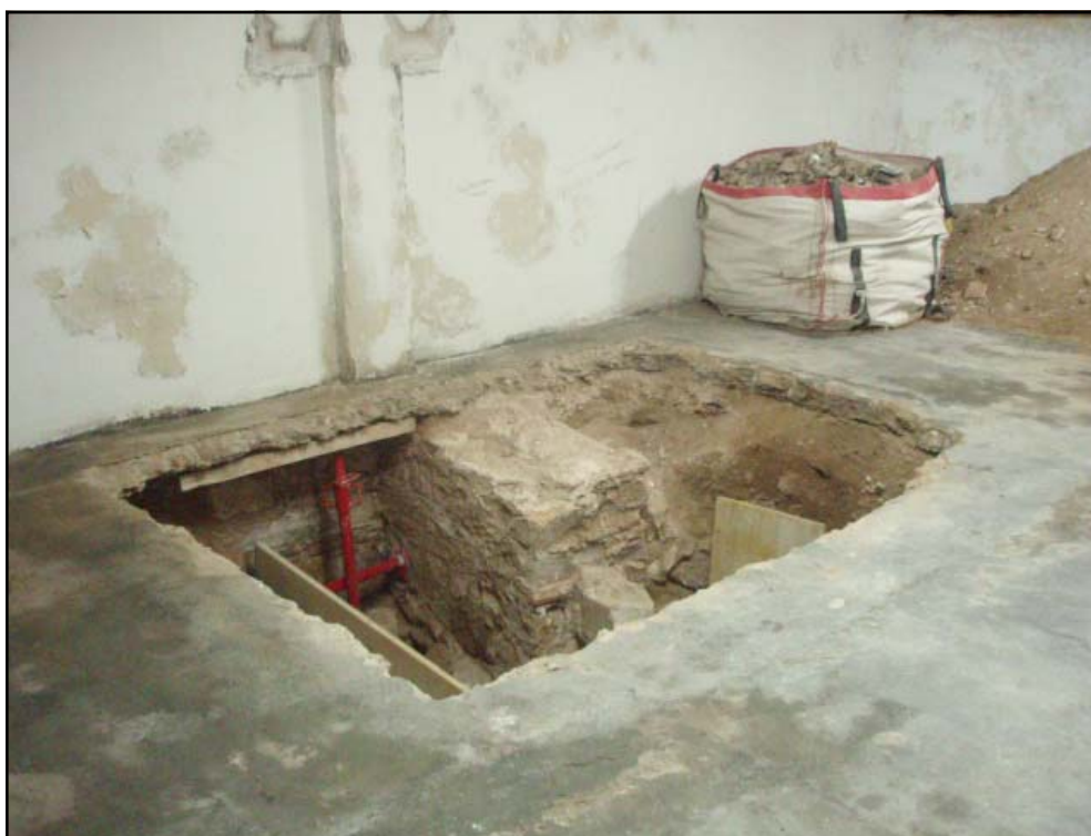
Vista general del sondeig 4