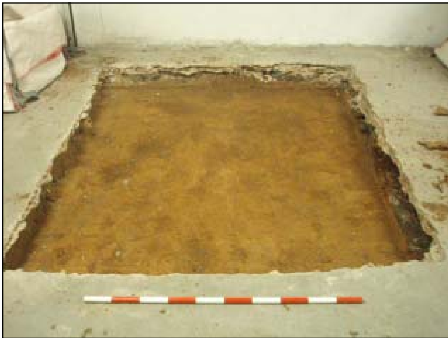
Vista de la U.E. 204

Possiblement es correspondria a un estrat de reblliment, sense que haguem localitzat cap estructura que es pogués vincular a aquest moment. Per sota de l'U.E.204 s'ha documentat un estrat, l'U.E. 205 localitzat a 0.90 m s.n.m., de 16 cm de potència, format per un nivell sorrenc de color marró amb la presència de petites pedres i fragments de material constructiu (maons). Aquest estrat ha estat datat igualment entre els segles XV-XVI.