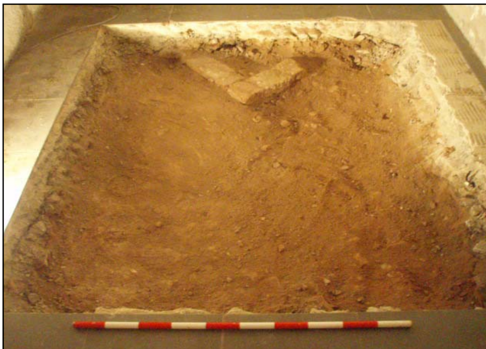
Vista de les U.E. 504 i 505

Les feines es van iniciar amb l'aixecament, per mitjans mecànics, de l'actual nivell de circulació, l'U.E. 501, corresponent a l'actual nivell de circulació, format per un paviment de rajoles de gres de 40 x 40 x 02 cm. Per sota de la pavimentació va aparèixer un estrat, l'U.E. 502, de 10 cm de potència, format per un nivell de formigó, el qual servia com a preparació de l'enrajolat. Seguidament, es va localitzar un estrat, l'U.E. 505 a 4.42m s.n.m., de 64 cm de potència, format per terra i runa (material constructiu modern, petites pedres i fragments de morter), el qual amortitzava un conjunt d'elements. El primer d'ells, corresponia a una estructura de planta quadrangular, l'U.E. 504 localitzada a 4.34m s.n.m., de 58 cm de potència, aixecada a partir de maons rectangulars de 25 x 15 cm lligats amb morter i disposats horitzontalment al trencajunt, la qual es va interpretar com una antiga arqueta per distribuir les canalitzacions subterrànies de la finca, datada cronològicament entre els segles XIX-XX.