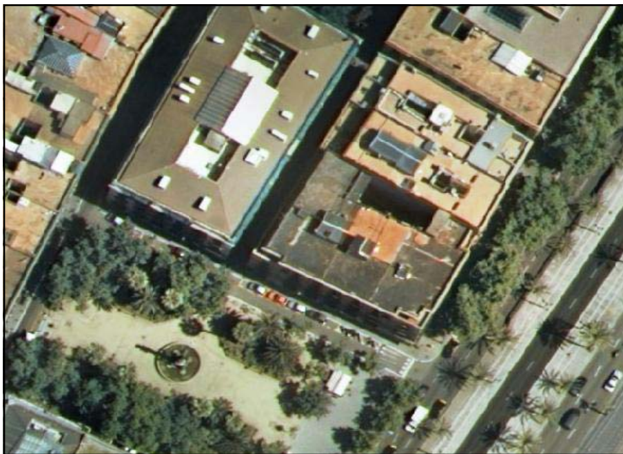
Imatges extretes del Projecte d'Intervenció del MHCB