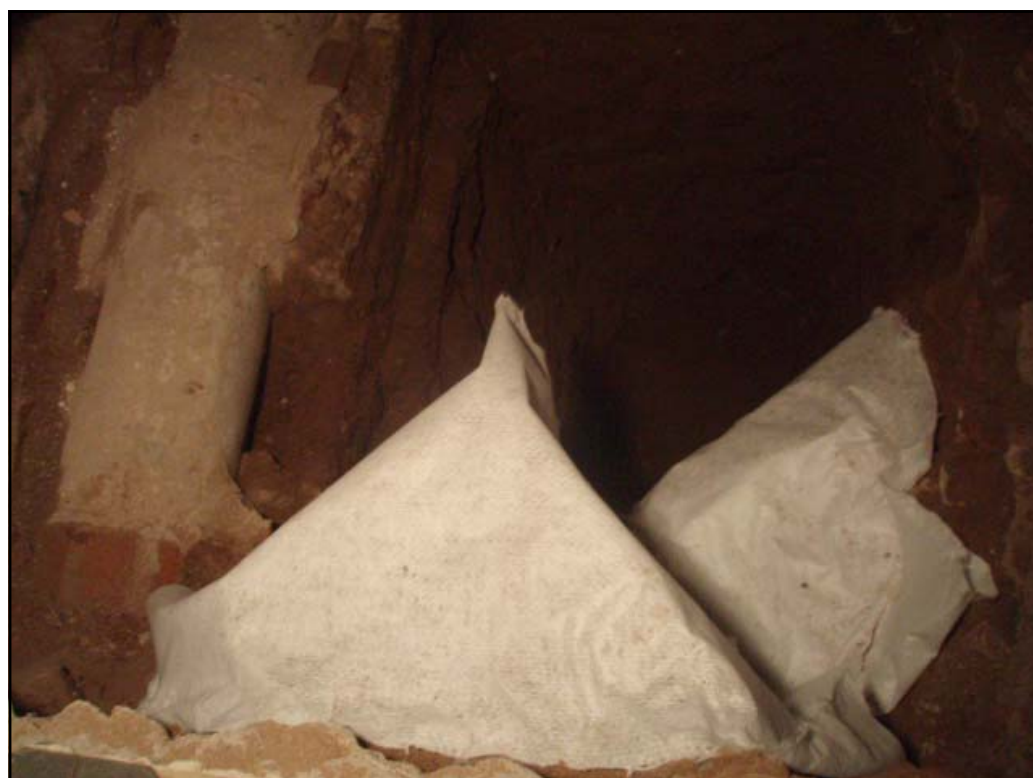
Vista de les estructures cobertes amb geotèxtil abans del cobriment