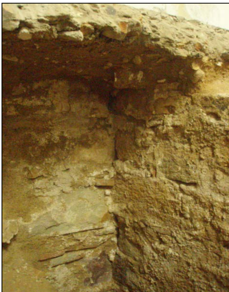
Detall de l'U.E. 303 i l'U.E. 307

El segon i últim nivell antròpic localitzat en l'interior del sondeig a 1.33 m s.n.m., pertanyia a la U.E. 305. Era un estrat, de 44 cm de potència, format per terres sorrenques de color marró fosc amb abundant presència de material constructiu (maons), no es va recuperar cap fragment ceràmic que ens permeti apropar-nos a la seva cronologia i ha estat interpretat com un nivell de reompliment. Per sota, van aflorar les sorres de platja corresponents al subsòl geològic, que estaven a 0.24m s.n.m.