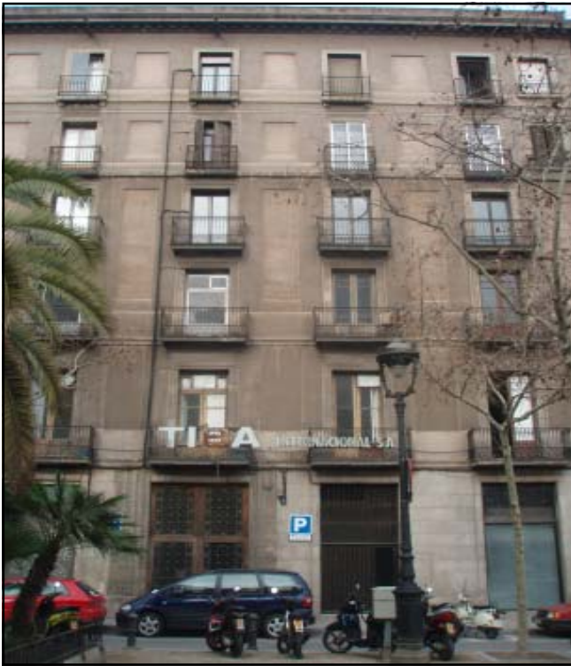
Façana de l'edifici ubicat a la Plaça Duc de Medinaceli 4