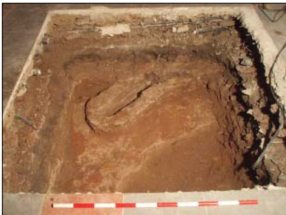
Vista de l'estructura U.E. 409 i 411