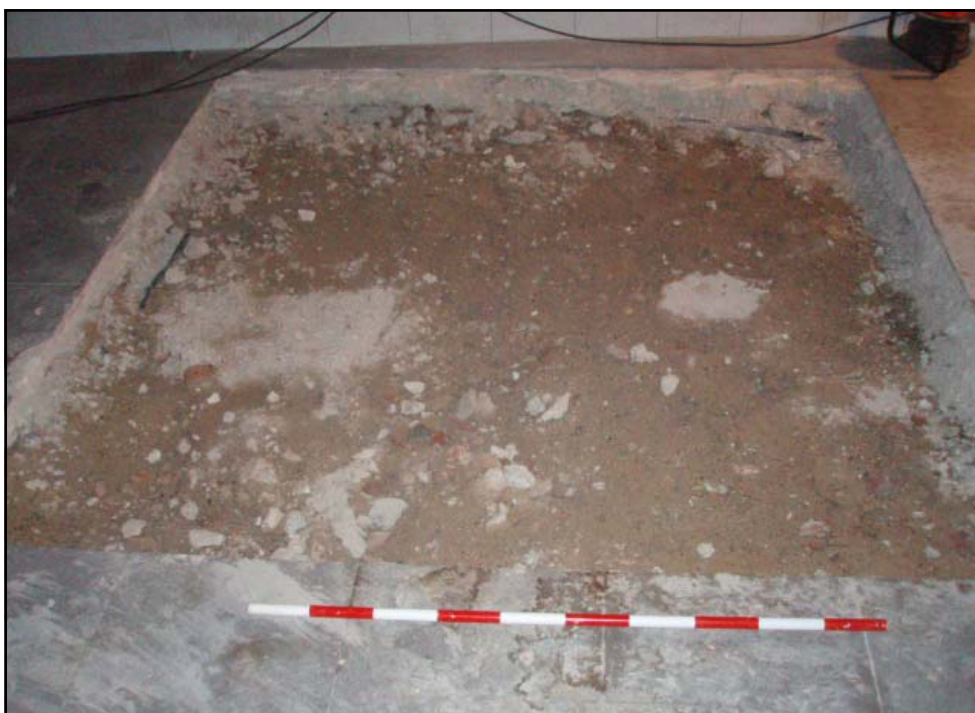
Vista del U.E. 403

Les feines es van iniciar amb l'aixecament, per mitjans mecànics, de l'actual nivell de circulació, U.E. 401, corresponent a l'actual nivell de circulació, format per un paviment de rajoles de gres de 40 x 40 x 02 cm. Per sota de la pavimentació va aparèixer l'estrat, U.E. 402, de 10 cm de potència, format per un nivell de formigó, el qual servia com a preparació de l'enrajolat. Seguidament es va documentar l'U.E. 403 a 4.41m s.n.m., corresponent a un estrat, de 24 cm de potència, format per terres de color marró fosc poc compacte amb l'abundant presència de petites pedres i material constructiu, el qual es va interpretar com un nivell de reompliment datat cronològicament en el segle XX.