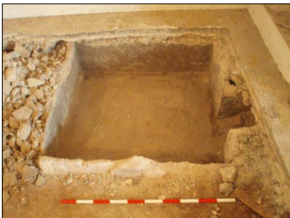
Vista de la U.E. 04 un cop excavat el seu interior

Aquesta ha estat localitzada a 4.55.m s.n.m. i tenia una planta quadrangular, de 1´15 x 1´20 m i 32 cm de potència. Estava realitzada a partir de maons, els quals només s´observaven en la seva cara externa, ja que en el seu interior presentava un lliscat de ciment, amb la finalitat de impermeabilitzar. Aquesta estructura, ubicada en la banda est del sondeig, va ser interpretada com les restes d´un antic dipòsit, ja que per la banda sud es va localitzar una obertura de 30 cm que possiblement funcionava com una sortida d´aigües de l´antiga finca. Per continuar amb les feines de rebaix en l´interior del sondeig es va procedir al desmuntatge d´aquesta estructura, amb el consentiment del Museu d´Història.