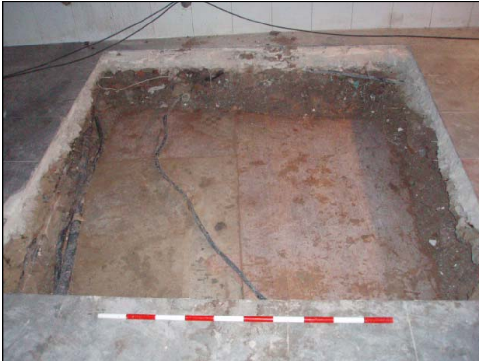
Vista del U.E. 404

Un cop aixecada aquesta pavimentació va aparèixer a 4.13m s.n.m., un estrat, l'U.E. 405, de 12 cm de potència, format per terres de color marró molt fosques poc compactes i amb la presència de material constructiu (maons), el qual va interpretar com un nivell de reompliment corresponent al segle XX.