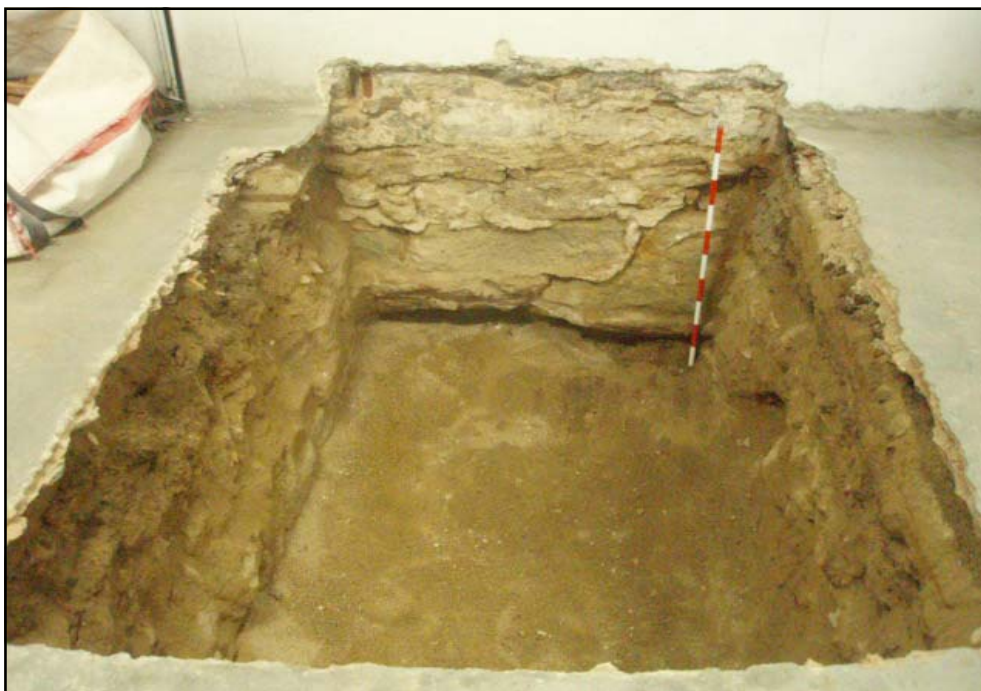
Vista final del sondeig 3

Seguidament, es va documentar l'últim nivell antròpic del sondeig, la U.e. 206 localitzat a 0.75 m s.n.m., corresponent a un estrat, de 42 cm de potència, format per un nivell sorrenc de color marró clar amb la presència de petites pedres i fragments de material constructiu (maons), del qual no es va recuperar cap fragment ceràmic que ens permeti apropar-nos a la seva cronologia. A continuació, i per sota van aparèixer les sorres de platja, pertanyents al subsòl geològic a una cota de 0.12 m s.n.m