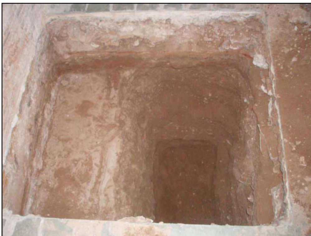
Vista final del sondeig 2