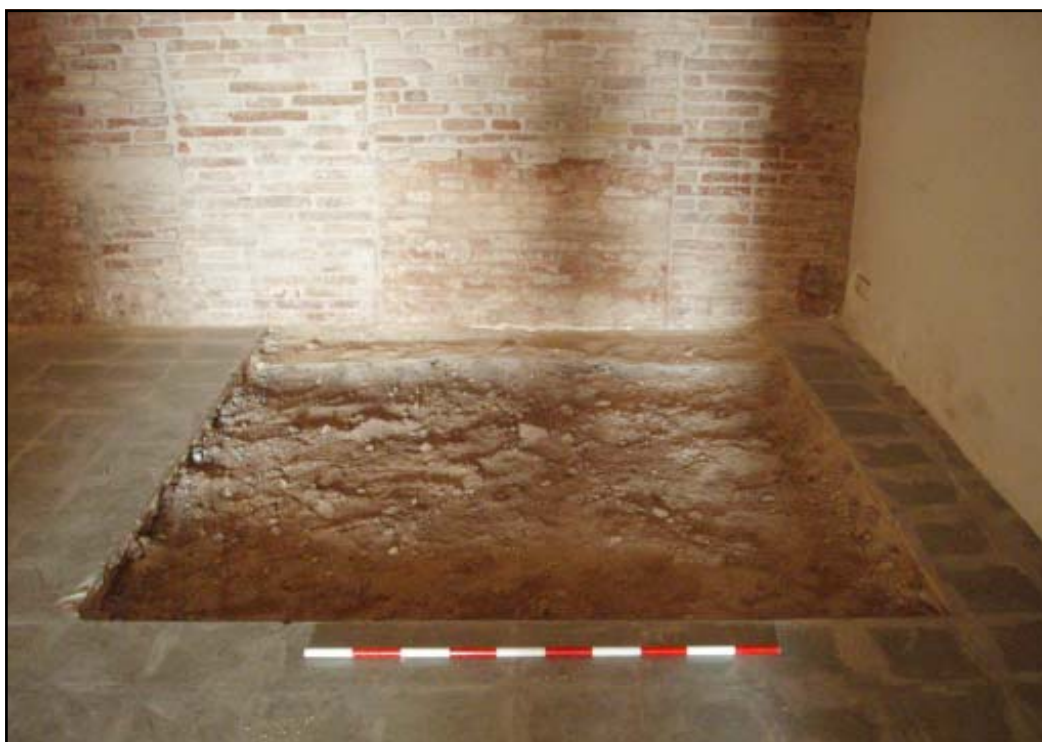
Vista de la U.E. 103

Seguidament, a 4.52 m s.n.m., es va localitzar un estrat, l'U.E. 103, de 28 cm de potència, format per terres poc compactes de color marró clar amb l'abundant presència de material constructiu, totxos, maons, pedres i morter. Interpretem aquest estrat com un nivell de reompliment, que se situaria al segle XX. Un cop extreta l'U.E. 103, es va posar al descobert un paviment, l'U.E. 104 (a, format per rajoles rústiques de color marró, les quals presentaven unes mides de 19x 19x 04 cm i que s'extenien per tota la superfície del sondeig. Aquest paviment va ser interpretat com un nivell de circulació antic de la finca, possiblement del moment de la seva construcció al segle XIX, ja que s'entregava a un parament intern de l'edifici (U.E. 107). Un cop documentat es va procedir a l'aixecament de l'enrajolat, amb el vist i plau del Museu d'Història.