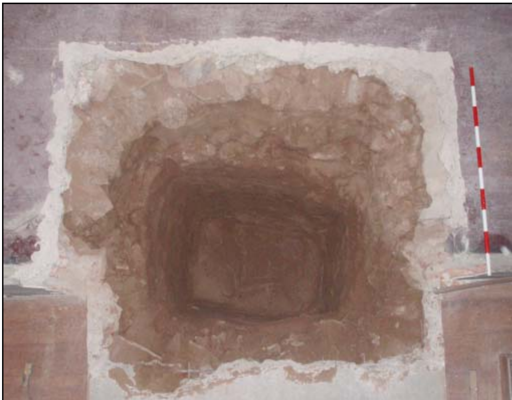
Vista final del sondeig 7

Les tasques es van iniciar amb el rebaix de l'actual nivell de circulació, l'U.E. 602, format per una capa de formigó de 20 cm de potència. Per sota d'aquest nivell es va localitzar a 3.49 m s.n.m. l'U.E. 602, corresponent a un estrat, de 95 cm de potència, format per terres sorrenques de color marró amb la presència de petits fragments de material constructiu (maons) i pedres, el qual es va interpretar com nivell de reompliment modern del que no es va recuperar cap fragment ceràmic. Aquest estrat cobria directament el subsòl geològic, format per sorres de platja de color marró clar, el qual va aparèixer a 2.54 m s.n.m.