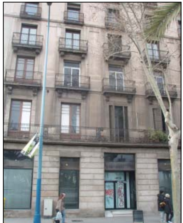
Façana de l'edifici ubicat al Passeig Colom 20