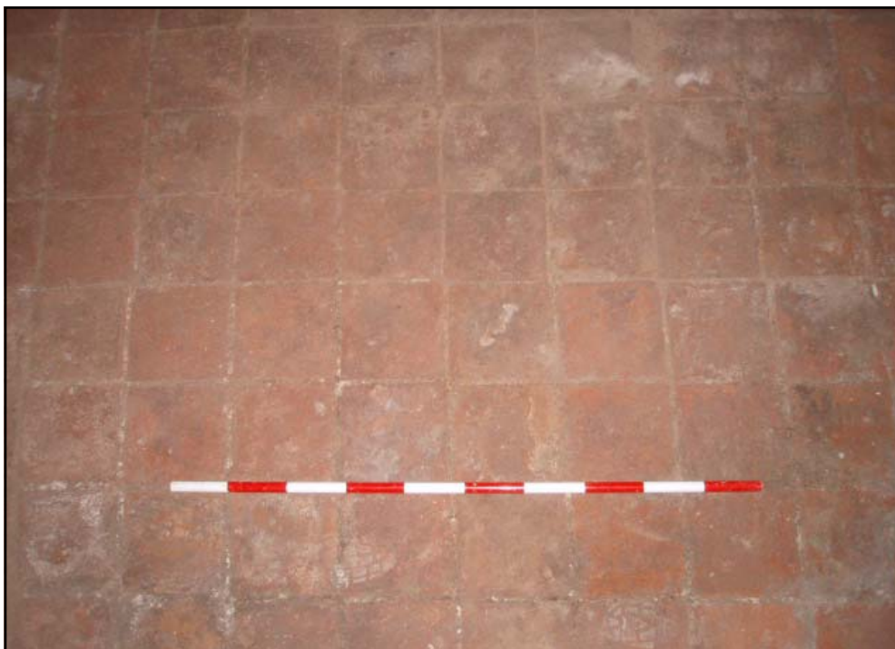
Vista del paviment 203

Les tasques es van iniciar amb l'aixecament, per mitjans mecànics, de l'actual nivell de circulació, corresponent a una capa de 2 cm de ciment portland (U.E. 201). Per sota del nivell de circulació va aparèixer un estrat, l'U.E. 202, d'entre 10 i 15 cm de potència, format per terres, material constructiu (maons), fragments de morter i ciment. Un cop excavat, es va documentar un paviment, la U.E. 203 a 1.35 m s.n.m., format per rajoles rústiques de color marró que s'extenia per tota la superfície del sondeig.