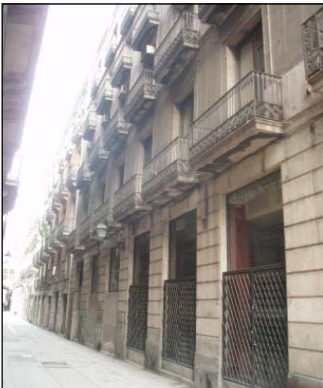
Façana de l'edifici ubicat al C/ de la Mercè