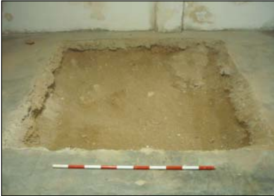
Vista del U.E. 302

A continuació, es va documentar un estrat, la U.E. 302 localitzat a 2.22 m s.n.m., de 30 cm de potència, format per terres de color marró poc compactes amb abundant presència de morter de calç, fragments de material constructiu (maons) i pedres, del qual no s'ha recuperat materials ceràmics i es va interpretar com un nivell de reompliment .