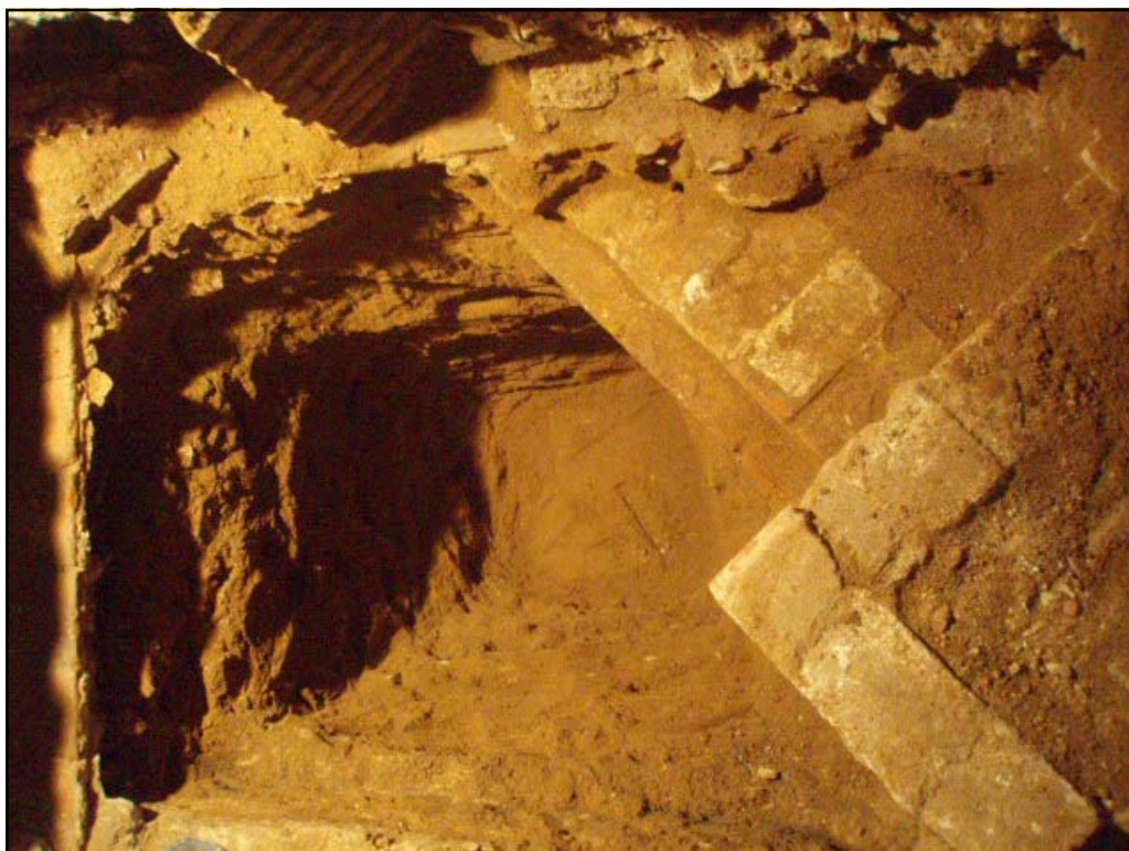
Vista final del sondeig 6