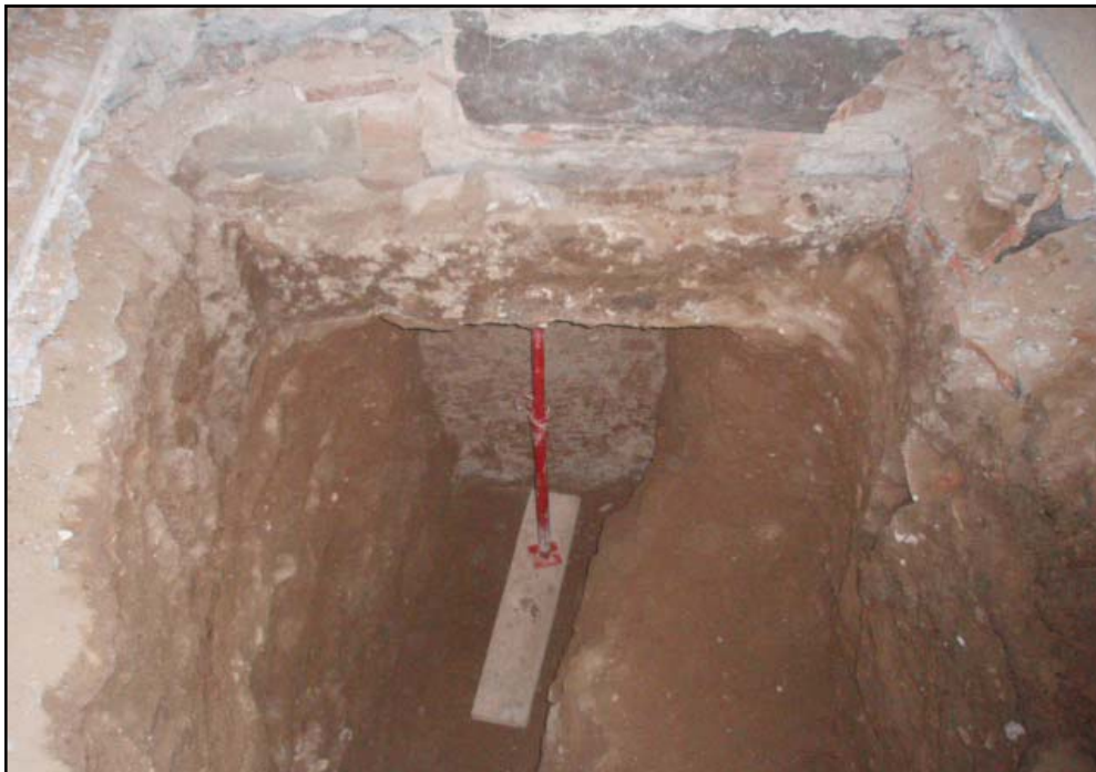
Vista final del sondeig 1

Un cop finalitzat el sondeig, es va posar de manifest la fonamentació del mur perimetral est de la finca, aixecat a partir de blocs mitjans de pedra escairats i lligats amb força morter de calç blanc. D'aquest mur se n'ha documentat 2'60 metres de potència tot i que no s'ha localitzat la seva fonamentació, ja que el seu origen es manté es una cota inferior.